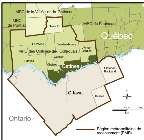
Figure 4.1 Gatineau dans la région métropolitaine de recensement (RMR) d'Ottawa-Gatineau

Source : Portrait de Gatineau. Profil démographique et socioéconomique. http://www.gatineau.ca/servicesenligne/infoterritoire/profil_web/profil1_pres.html (Ville de Gatineau, 2011d)