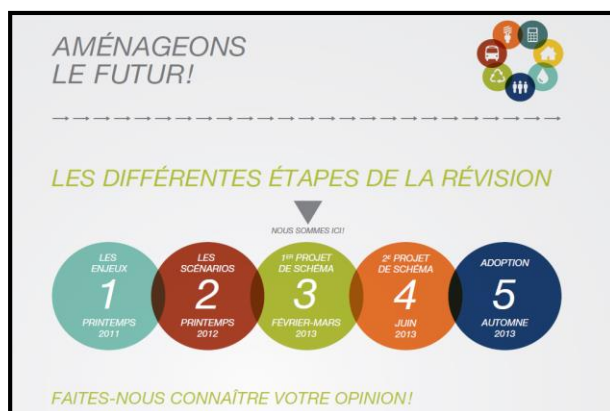
Figure 3.1 Les cinq étapes du processus de révision du schéma d'aménagement et de développement