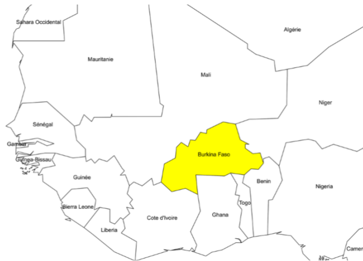
Illustration 1. Carte du Burkina Faso