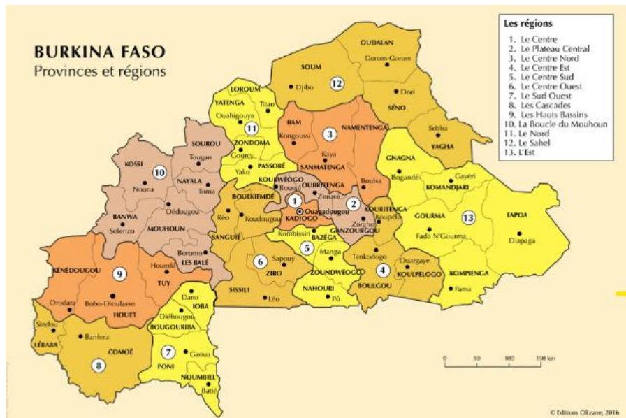
Illustration 3. Carte des provinces et régions du Burkina Faso